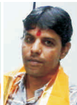
सूरत ( गुज. )