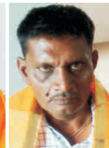
सूरत ( गुज. )