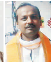
सूरत ( गुज. )