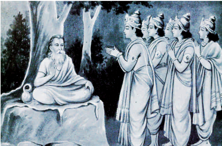
महर्षि दधीचि से देह दान की प्रार्थना करते देवता

तारा संस्थान के आनन्द वृद्धाश्रम के नए भवन के लिए भी हमने दानदाताओं के लिए जो योजना बनाई तो ये तीन नाम स्वतः पसंद बने। मुझे अच्छी तरह पता है कि नाम किसी के लिए महत्वपूर्ण नहीं होता है और इन महान दानदाताओं की बराबरी करना असंभव है, और आप लोग भी इसलिए देते हैं क्योंकि आपकी भावना है किसी के लिए अच्छा करने की बस कोई योजना सामने हो तो अपने बजट को आगे पीछे करके उस योजना से जुड़ जाते। हम भी आपका नाम इसलिए लिखना चाहते हैं कि उतने बड़े न